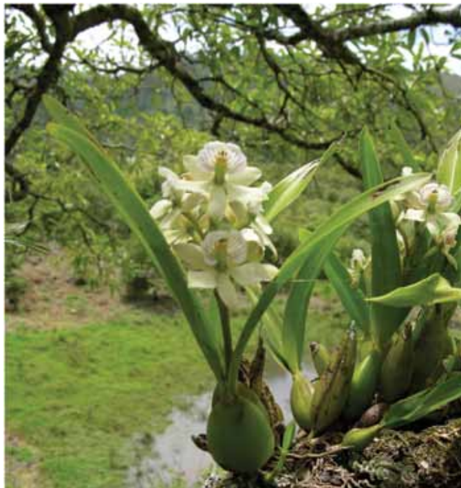
Orquídea epífita de la zona de Copán, Honduras.

En síntesis, se puede decir que son muchas las variables que condicionan la presencia o ausencia de epífitas en diferentes ambientes. Sin embargo, con este estudio se lograron identificar algunas de estas variables que